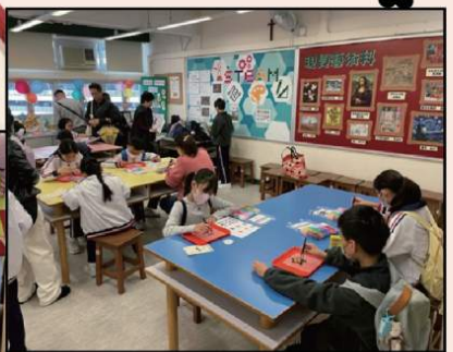
齊來做手工，愉快又輕鬆！