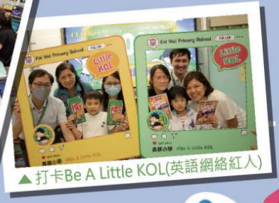
▲打卡Be A Little KOL(英語網絡紅人)