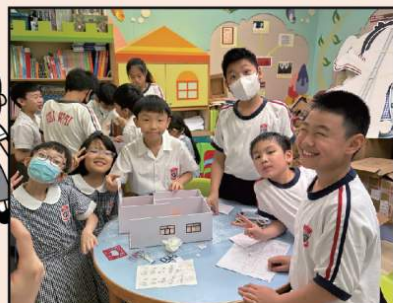
除常識課堂外，香港大學專業團隊亦於「重趣時光」時段，帶領同學學習如何創建和設計自己的三維虛擬環境，延展以STEAM策略激發他們自主學習。