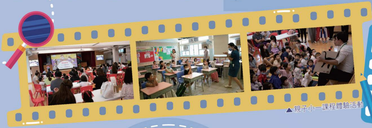
▲親子小一課程體驗活動

本校十分重視幼稚園學生升讀小學時的適應，希望透過幼稚園生到小學參觀及上課，讓學生慢慢地適應學習生活上的改變。此外，本校也會舉辦不同的活動及課程，讓幼稚園學生享受小學生活。