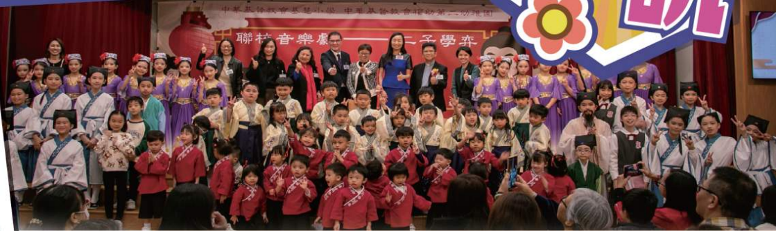
▲ 本校與中華基督教會福幼第二幼稚園合辦音樂劇 — 《二子學弈》