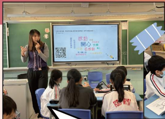
中文科課堂善用電子學習工具展示學生討論結果進行互評，加強「生生互動」課堂效能。