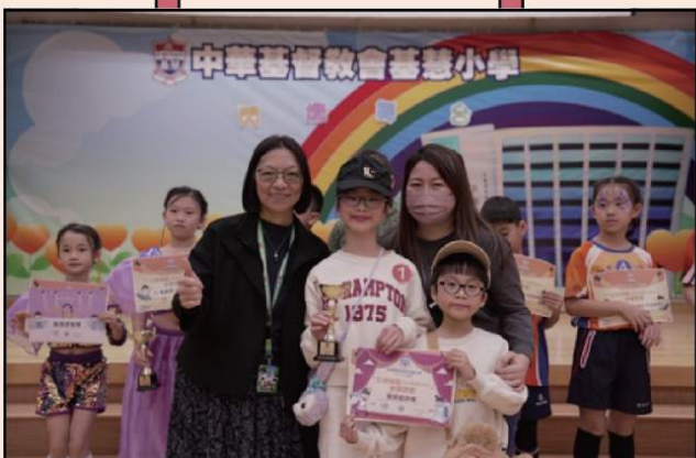
「兄弟姊妹Catwalk Show」為我們創造了美好的回憶！