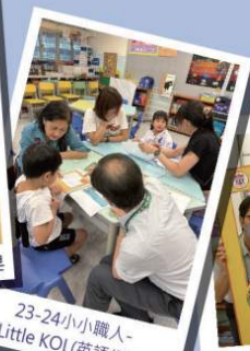
23-24小小職人- Be A Little KOL(英語網絡紅人)