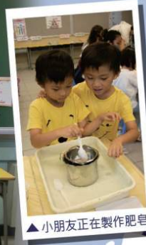
▲小朋友正在製作肥皂