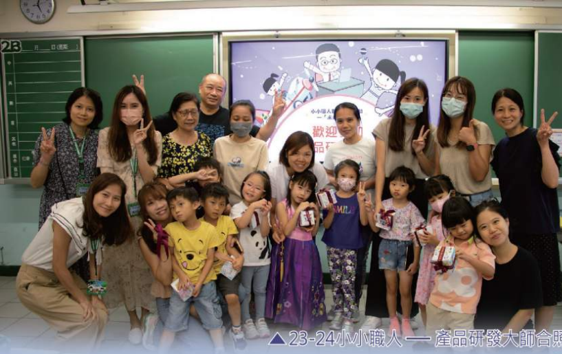
▲23-24小小職人——產品研發大師合照