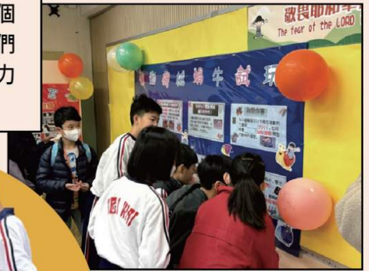
「明日領袖」發揮才能！