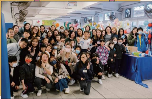
感謝一眾家長們的鼎力支持，你們的支持是我們最強的動力！