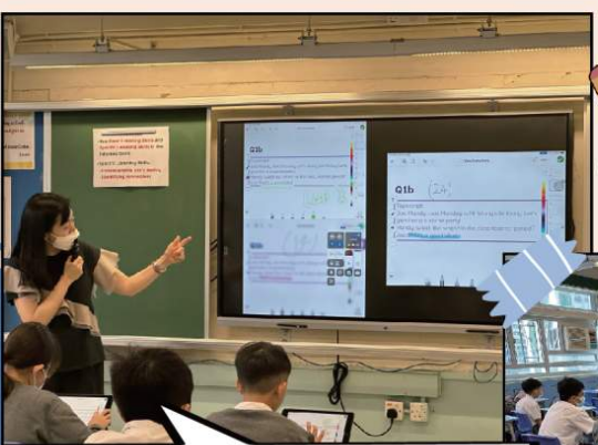
英文科老師透過智能互動電視「高展示」學生作品，誘發學生自主學習的動機。