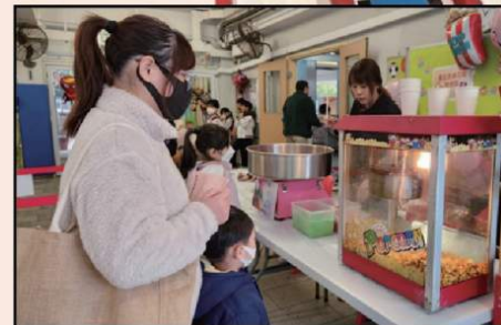
竟然有爆谷吃，真令人意想不到！好味啊！