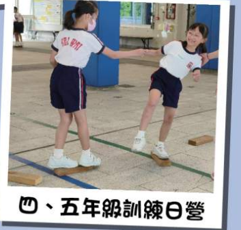
四、五年級訓練日營